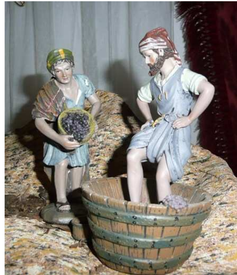
Visitas Nacimiento; Festivos, Sábados y domingos de Navidad